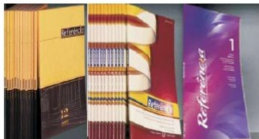
IMAGEM 5 – Capas das Séries da Revista de Enfermagem Referência: à esquerda encontra-se a da I Série; ao centro a da II Série e à direita a da III Série.