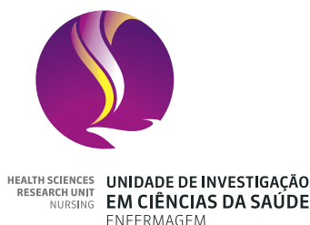
IMAGEM 4 – Logótipo da Unidade de Investigação em Ciências da Saúde – Enfermagem.

2012 – A UICISA-E muda de instalações para o edifício da Residência (Pólo C da ESEnFC).