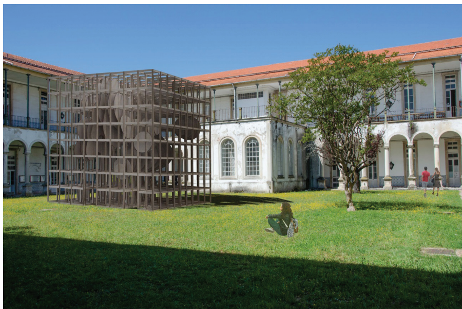
Figura 1. Modelo físico modelado, fabricado e enquadrado digitalmente num cenário real.

Por último, e para fechar o ciclo, os estudantes são motivados a integrar e promover os produtos materializados de novo num ambiente digital através de várias técnicas criativas de fotomontagem, vídeo-montagem, vídeo-projeção e realidade aumentada (Figura 1). Independentemente das disciplinas lecionadas pelo autor estarem todas elas vocacionadas para a intangibilidade dos processos informáticos, este princípio metodológico, no qual se inclui uma permeabilidade entre o mundo material e o mundo da informação, está quase sempre presente.