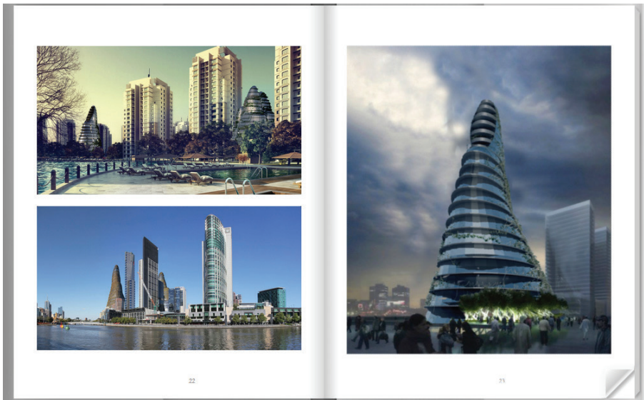
Figura 2. T-City Project. Adaptado de: “O Livro das Cidades do Futuro - T-City Project” de M. Couceiro, A. Serafim, D. Cunha, J. Costa, L. Ribeiro, 2016, recuperado de: http://www.digitaldarq.info/cidadesdofuturo/#page/22 .

Foi também privilegiada a simulação e criação de modelos físicos capazes de servir de elementos de estudo e de interação com os modelos virtuais. Ulteriormente este livro virtual foi exposto numa instalação interactiva com um monitor tátil e projetor digital, assim como divulgado ao mundo através de um sítio web no qual a estrutura física de um livro foi simulada virtualmente (Couceiro, 2016).